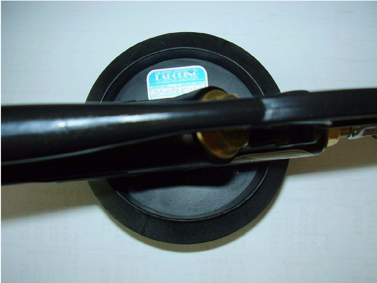
Zaštitni žig u obliku naljepnice